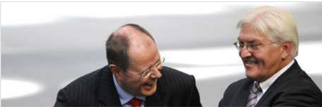
Wollen die Lasten für die Krise nicht dem Steuerzahler überlassen: Kanzlerkandidat Frank-Walter Steinmeier und Finanzminister Peer Steinbrück

Die Minister Steinmeier und Steinbrück fordern eine neue Steuer - um die Finanzindustrie an den Kosten der Krise zu beteiligen.